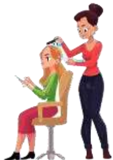
Парикмахер -стилист 19-23 лет