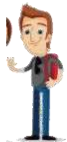
Студент 15-19 лет