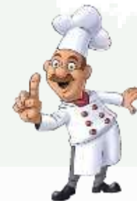
Управляющий рестораном 30-33 лет