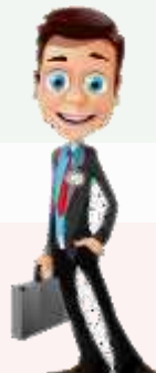
Менеджер зала ресторана 27-30 лет