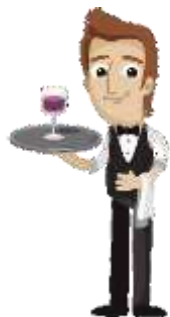
Официант, бармен 19-23 лет