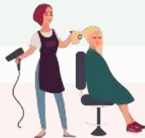
Стилист, визажист, косметолог 25-27 лет