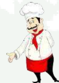
Владелец ресторана 33-...