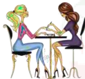
Мастер ногтевого сервиса 23-25 года