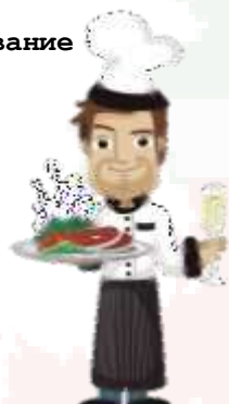
Старший официант 23-27 года